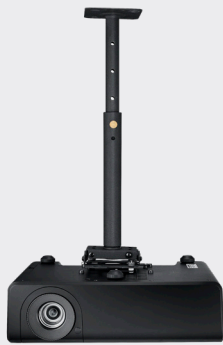
SUPPORT DE MONTAGE AU PLAFOND UNIVERSEL DELL POUR PROJECTEURS DELL