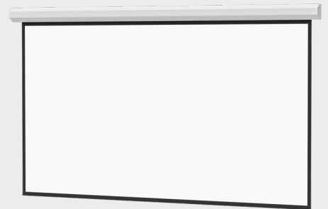
ÉCRAN POUR PROJECTEUR CHIEF COSMOPOLITAN 133 POUCES