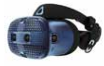
HTC VIVE Cosmos 3D VR ヘッドセット - MFG 99HARL000-00 Dell パーツ AA809644

スピーカーフォンを内蔵したマルチポートアダプター。あらゆる接続に対応する会議用ソリューションです。