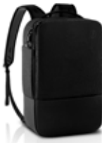
Dell Pro ハイブリッドブリーフケースバックパック 15 - PO1521HB

この Teams 認定のワイヤレスヘッドセットがあればどこでも簡単にコラボレーションでき、アクティブノイズキャンセリング機能とスマートセンサーにより、通話を自動的にミュート/ミュート解除できます。