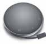
Dell モバイルアダプタースピーカーフォン - MH3021P

地球に優しい素材によるバックパック。裏地は EVA フォームの緩衝材で、ノートパソコンを衝撃から守ります。バックパックからブリーフケースモードへ変換しやすく、持ち運びに便利です。