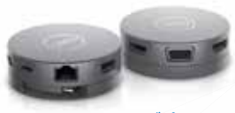
Dell USB-C モバイルアダプター - DA310

この HTC VIVE Cosmos 3D VR ヘッドセットなら、仮想現実へ飛び込んで行くような体験ができます。シンプルな設計でベースステーションは不要になり、フリップアップディスプレイで通話やテキストへも素早く応答できます。