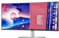
Dell デジタル ハイエンド シリーズ 38 インチ曲面 USB-C ハブ モニター - U3821DW

DCI-P3 カバー率 95% を実現し、内蔵スピーカーを備えた 37.5 インチ ウルトラワイド WQHD+ 曲面ハブ モニター。鮮やかさ、生産性、接続性を体感できます。