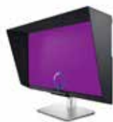
Dell デジタル ハイエンド シリーズ 32 インチ HDR PremierColor モニター - UP3221Q

DCI-P3 カバー率 95% を実現し、内蔵スピーカーを備えた 37.5 インチ ウルトラワイド WQHD+ 曲面ハブ モニター。鮮やかさ、生産性、接続性を体感できます。