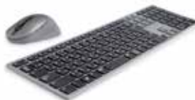
Dell Premier マルチデバイス ワイヤレス キーボードおよびマウス - KM7321W

世界で初めて 2K ミニ LED バックライト直下型 ディミングゾーンを実現*、4K HDR コンテンツを作成できる驚異的なプロフェッショナル向けモニター。