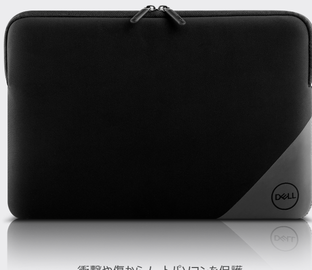
衝撃や傷からノートパソコンを保護