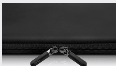
ダブルジッパー設計