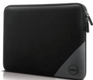
Dell エッセンシャル スリーブ 13

耐久性と耐水性に優れた軽量のネオプレンゴム素材のスリーブです。開閉しやすいダブルジッパー仕様。内側には柔らかい起毛裏地付きのナイレックス素材を使用、PC を傷から守ります。