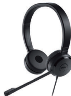
Dell Pro ステレオ ヘッドセット UC150

デュアル モード接続 (2.4GHz ワイヤレスまたは Bluetooth) に対応。約 36 カ月のバッテリー持続時間により生産性を向上します。安心の 3 年間保証。1600dpi のマルチ OS 対応。