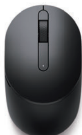
Dell モバイル ワイヤレス マウス MS3320W - ブラック

耐久性と耐水性に優れた軽量のネオプレンゴム素材のスリーブです。開閉しやすいダブルジッパー仕様。内側には柔らかい起毛裏地付きのナイレックス素材を使用、PC を傷から守ります。