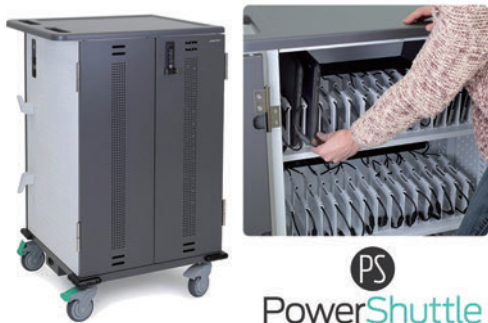
Ergotron社製 YES45 Adjusta 充電カート

13.3 インチまでの端末、45 台まで収納・充電可能。保管庫内にコンセントを内蔵。端末の出し入れに安心の鍵付き仕様。充電効率に優れ、使用電力にも配慮した、輪番充電に対応。設計・製造が適切な安心の品質保証。配達地域により、パーツ番号が異なるため、詳しくは弊社営業までお問い合わせください。