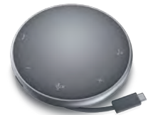
DELL モバイル アダプター スピーカーフォン – MH3021P

このTeams認定のワイヤレス ヘッドセットがあればどこでも簡単にコラボレーションでき、アクティブ ノイズ キャンセリング機能とスマート センサーにより、通話を自動的にミュート/ミュート解除できます。