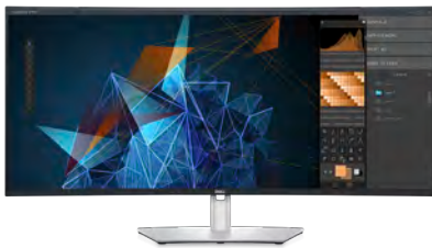
DELL デジタル ハイエンド シリーズ40インチ曲面 WUHDモニター – U4021QW

Dellデジタル高解像度Webカメラを最大限に活用できるように設計された周辺機器を使用することで、充実したユーザー エクスペリエンスを実現できます。