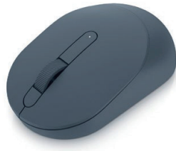
Dell モバイルワイヤレス マウス - MS3320W

高さ調整・回転機能に加え、有線LAN端子も内蔵。23.8インチワイドUSB-C HUBモニターです。