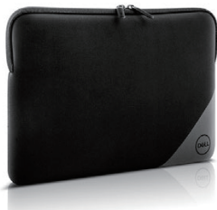
Dell エssenシャル スリーブ - ES1320V

静音設計のフルサイズキーボードとマウスのセット、プログラム可能なショートカット機能、持続時間が36か月*のバッテリーが、日々の学習を強力にサポートします。