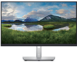
Dell プロフェッショナルシリーズ P2422HE 23.8インチ USB-C HUBモニター

高さ調整・回転機能に加え、有線LAN端子も内蔵。23.8インチワイドUSB-C HUBモニターです。