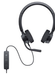
Dell プロステレオ ヘッドセット - WH3022

2.4GHzワイヤレスまたはBluetooth 5.0を介してほぼすべてのPCに接続でき、バッテリーは36か月*持続します。