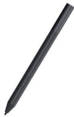
Dellアクティブ ペン - PN350M

防水機能付きのぴったりフィットするネオプレンゴム素材のDell エssenシャル スリーブ13を使用すると、ノートPCを液体ごぼれ、衝突、ひっかかりから守ることができます。