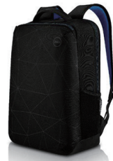
Dell エssenシャル バックパック15 - ES1520P

紙にペンで書いているかのように、2-in-1でメモを取ったり、図を描いたりできます。最大1,024レベルの筆圧感度を備えたペンは、手の自然な延長のように使用できます。