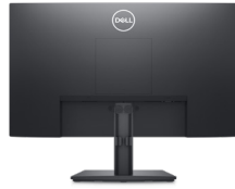
背面図 - ケーブル管理