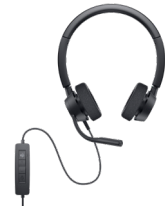
DELL PROステレオ ヘッドセット | WH3022

静音設計のフル サイズ キーボードとマウスのセット。プログラム可能なショートカットと36か月**のバッテリー持続時間で日々の生産性を高めます。