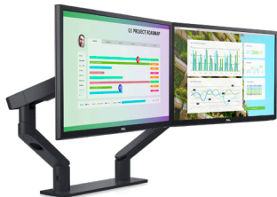
DELLデュアル モニター アーム | MDA20

モニター2台とシステムをマウントできる包括的なソリューションでデスクがすっきりと片付きます。簡単に取付けられることができる革新的なモニター アーム。スイッチだけで回転角度を切り替えることができます。