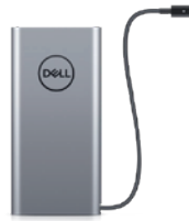
Dell USB-CノートPC用モバイル バッテリー 65W/65WHR | PW7018LC

デュアルモード接続(2.4GHzワイヤレスまたはBluetooth)と36か月のバッテリー持続時間により、シームレスに作業できます。