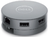
Dell USB-Cモバイル アダプター | DA310

幅広い種類のポートを搭載した、コンパクトな7-in-1 Dell USB-Cモバイル アダプターです。モニター、プロジェクター、ヘッドセット、キーボード、マウス、フラッシュドライブ、その他の周辺機器などの多様なデバイスとシームレスに接続できます。