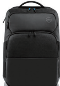
Dell Proスリム バックパック 15 | PO1520PS

幅広い種類のポートを搭載した、コンパクトな7-in-1 Dell USB-Cモバイル アダプターです。モニター、プロジェクター、ヘッドセット、キーボード、マウス、フラッシュドライブ、その他の周辺機器などの多様なデバイスとシームレスに接続できます。