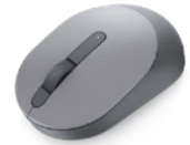
Dellモバイル ワイヤレス マウス | MS3320W

環境に優しいDell Proスリム バックパック15は、ノートPCやその他の必需品を安全に保護します。防水保護コーティングのおかげで、雨に降られても中のデバイスが濡れることはありません。