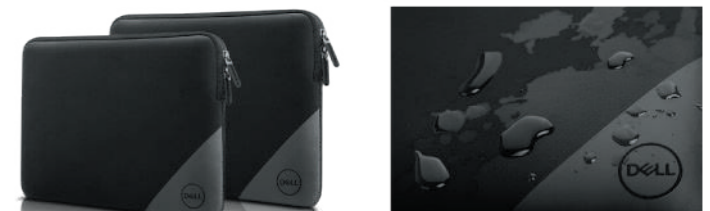
Dell エssenシャルスリーブ 13/15 13 ES1320V : 460-BCOJ 15 ES1520V : 460-BCPE

耐久性と耐水性に優れた軽量なネオプレンゴム素材のスリーブです。開閉しやすいダブルジッパー仕様。内側には柔らかい起毛裏地付きのナイレックス素材を使用、PC を傷から守ります。