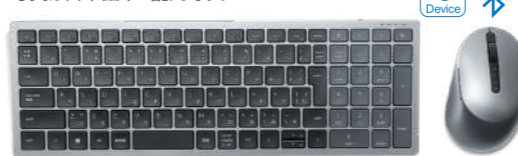
写真は日本語キー配列です。