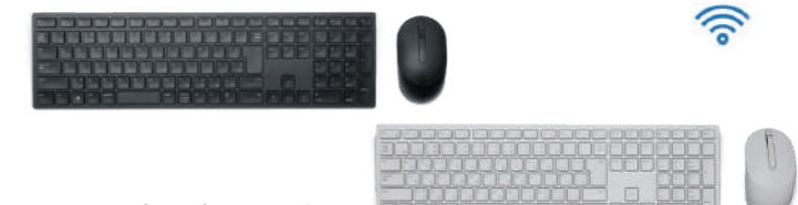
写真は日本語キー配列です。

無線 2.4GHz に対応した安価なフルサイズキーボードとマウス。理論値36ヶ月の電池持ち設計。3年保証、チルトに対応。