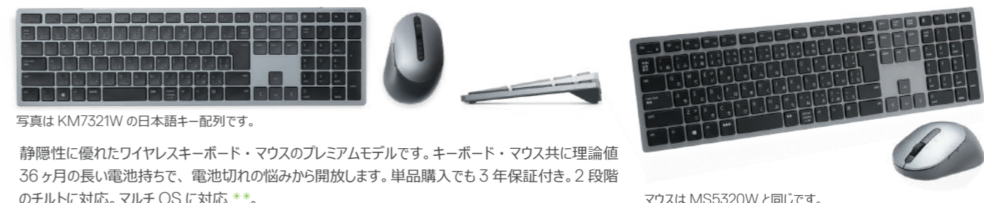
写真は KM7321W の日本語キー配列です。

パスワードを使わず、正確、安全に指紋認証を行う、Windows Hello によるサインインで、スプーフィング攻撃や不正ログインからパソコンを保護します。マウスが読み取った指紋は、エンタープライズグレードの 256 ビット AES 方式で暗号化し、ID 認証情報を保護します。