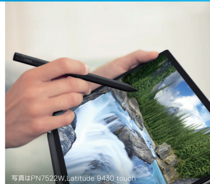
写真はPN7522W, Latitude 9430 touch