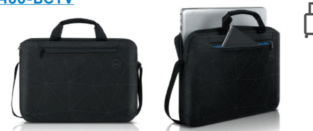
Dell エssenシャル ブリーケース 15 ES1520C 460-BCTV

外装には、再生皮革戦士を 50% 使用、インナーライナーには 50% * リサイクルポリエステルが含まれています。贅沢な手触りと美しさを備えた素材を採用。レザーカット加工が上質なデザインを際立たせています。15 インチは Latitude 9520 に、14 インチは 9420、7420、5420 に最適です。 * 重量ベース