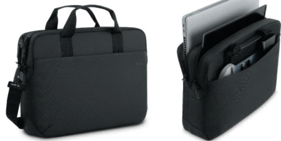
Dell EcoLoop Pro ブリーケース CC5623 11.5ℓ 460-BDNE

840D Ballistic ファブリックを採用。1680D の Premier シリーズより柔らかく軽量で扱いやすいのが Pro シリーズです。傷防止加工の Nylex 裏地が、ノートパソコンを水濡れや衝撃、傷からノートパソコンを守ります。