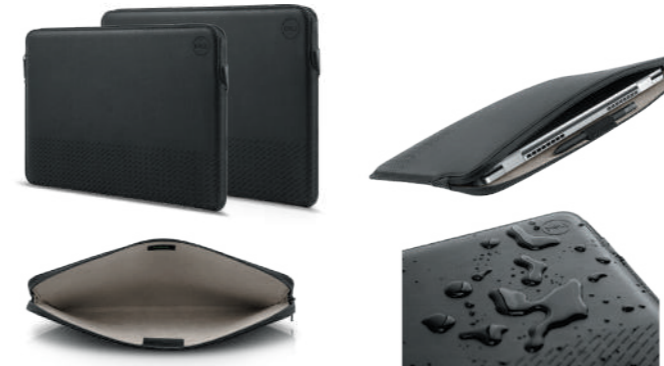
Dell EcoLoop レザースリーブ 14/15 14 PE1422VL : 460-BDEI 15 PE1522VL : 460-BDEC

外装には、再生皮革戦士を 50% 使用、インナーライナーには 50% * リサイクルポリエステルが含まれています。贅沢な手触りと美しさを備えた素材を採用。レザーカット加工が上質なデザインを際立たせています。15 インチは Latitude 9520 に、14 インチは 9420、7420、5420 に最適です。 * 重量ベース