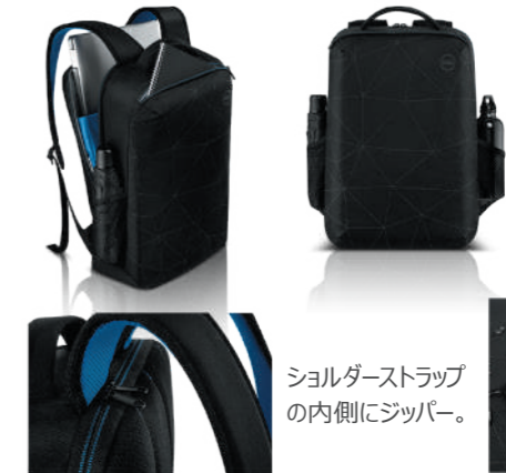
Dell エssenシャル バックパック 15 ES1520P 460-BCTY

軽量でシンプルなデザイン。悪天候にも安心の撥水仕様。チャージパスルード対応、キャリーケースストラップ付で出張時も楽に移動できます。