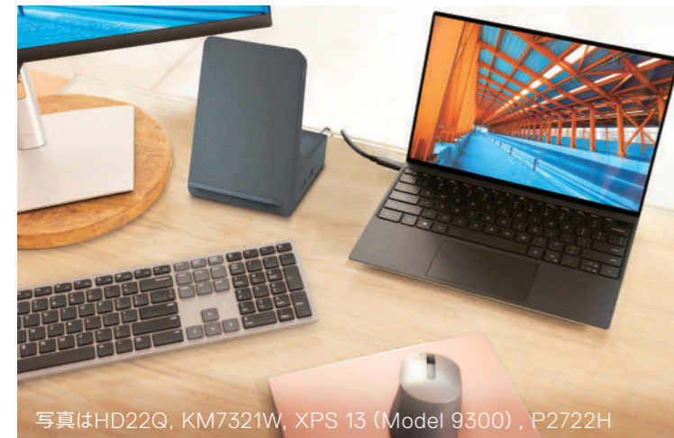
写真はHD22Q, KM7321W, XPS 13 (Model 9300), P2722H