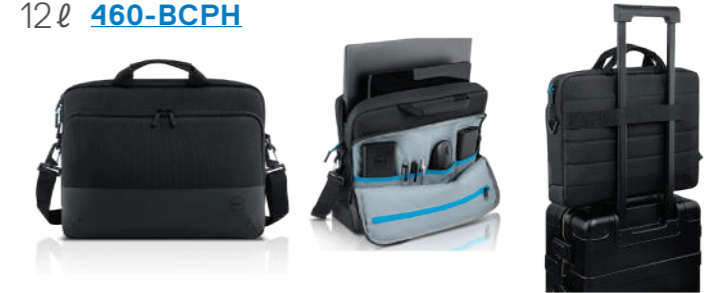
Dell Pro スリムブリーケース 15 PO1520CS 12ℓ 460-BCPH

軽量のブリーケースにはパッド入りのハンドルが付いており、外出時の持ち運びも快適です。スーツケースの上に乗せられます。