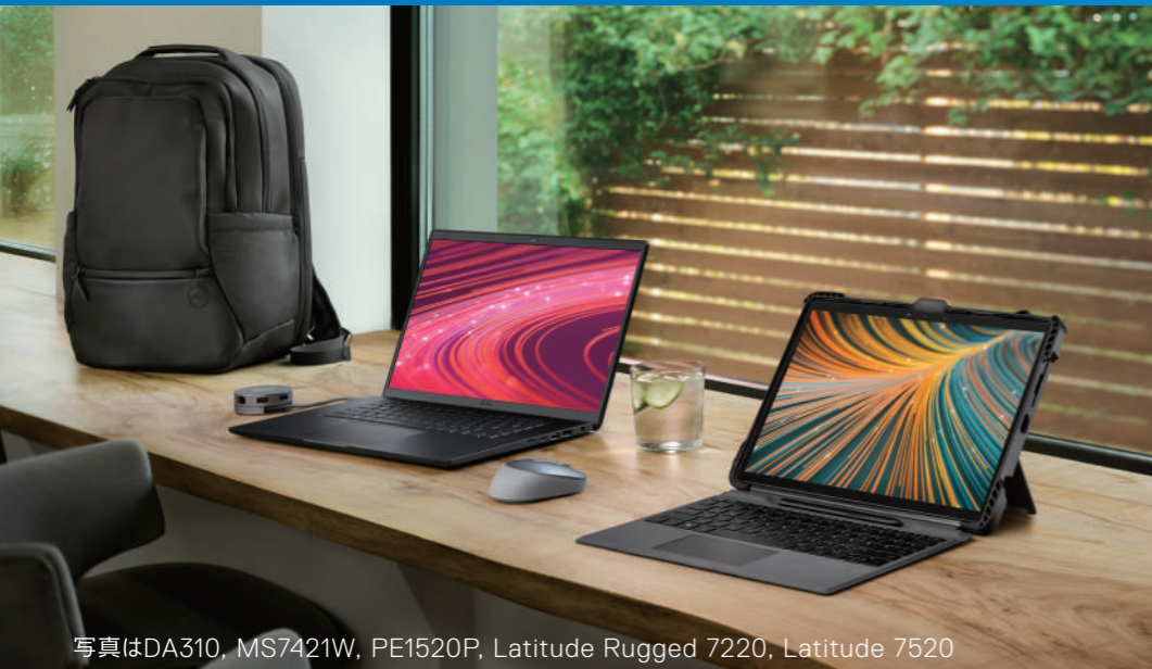
写真はDA310, MS7421W, PE1520P, Latitude Rugged 7220, Latitude 7520