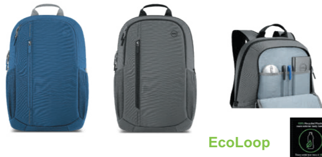
Dell EcoLoop Urban バックパック グレー CP4523G : 20ℓ 460-BDKP ブルー CP4523B : 20ℓ 460-BDLD

画面サイズが 15 インチまでのほとんどの Dell 製ノートパソコンに対応します。専用のパッド付きスリーブで PC を保護します。前部分の整理スペースにはペンスロットとスリッ ポケットがあり、マウスやモバイル バッテリーなどの小アイテムを収納できます。縦型ポケットは必需品をすばやく簡単に出し入れできます。両側には伸縮するメッシュ ポケットがあり、水筒、傘などのアイテムを収納できます。