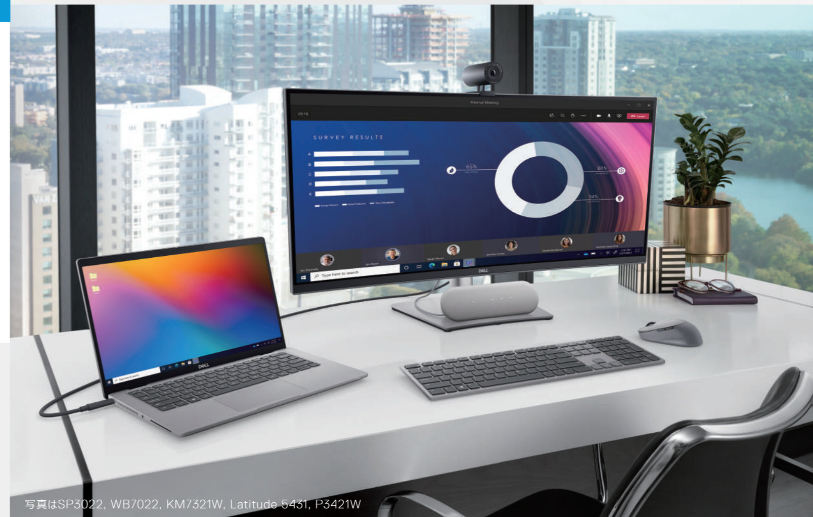
写真は SP3022, WB7022, KM7321W, Latitude 5431, P3421W

業務効率を向上させる、デル・テクノロジーズの周辺機器。 エンドユーザーの求める、円滑なコラボレーションに必要なアイテムを提供します。