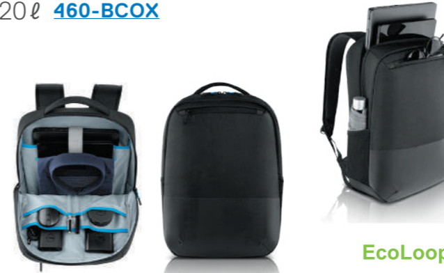
Dell Pro スリムバックパック 15 PO1520PS 20ℓ 460-BCOX

軽量でシンプルなデザインが特徴です。お求めやすい価格ながら、便利な機能を備えた 15 インチ用バックパックです。安価ですが、表面撥水仕様、トレンドの自立できるバックパックです。