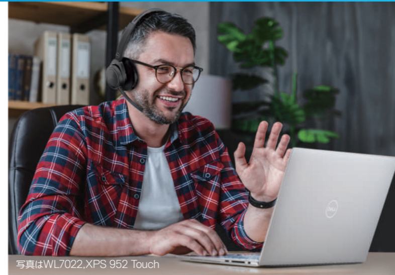
写真はWL7022,XPS 952 Touch

アクティブノイズキャンセリング希望と聴覚保護機能を搭載した、充電台付きのワイヤレスヘッドセットです。無線 2.4GHz (ドングル使用) と、Bluetooth に対応しています。調整可能な合成皮革のヘッドバンドとイヤークッションは、快適な通話を提供します。携帯に便利なポーチ付きです。