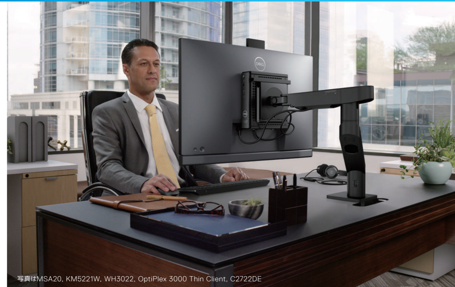
写真はMSA20, KM5221W, WH3022, OptiPlex 3000 Thin Client, C2722DE