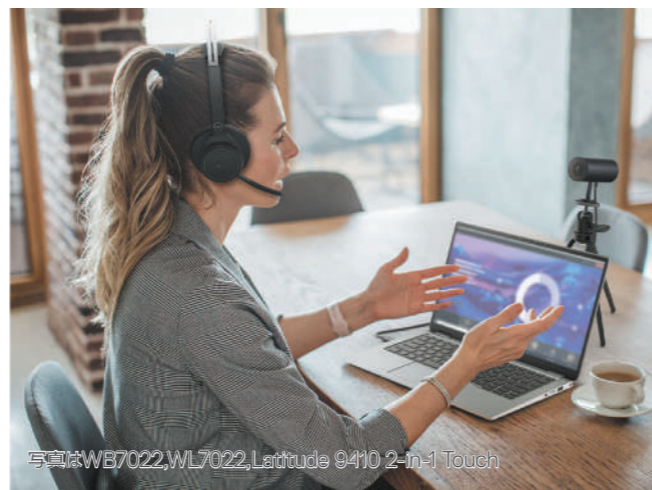
写真はWB7022,WL7022,Latitude 9410 2-In-1 Touch

日本では、以下の三脚とは異なるエレコム社製 AC-SS2WBK を提供しています。