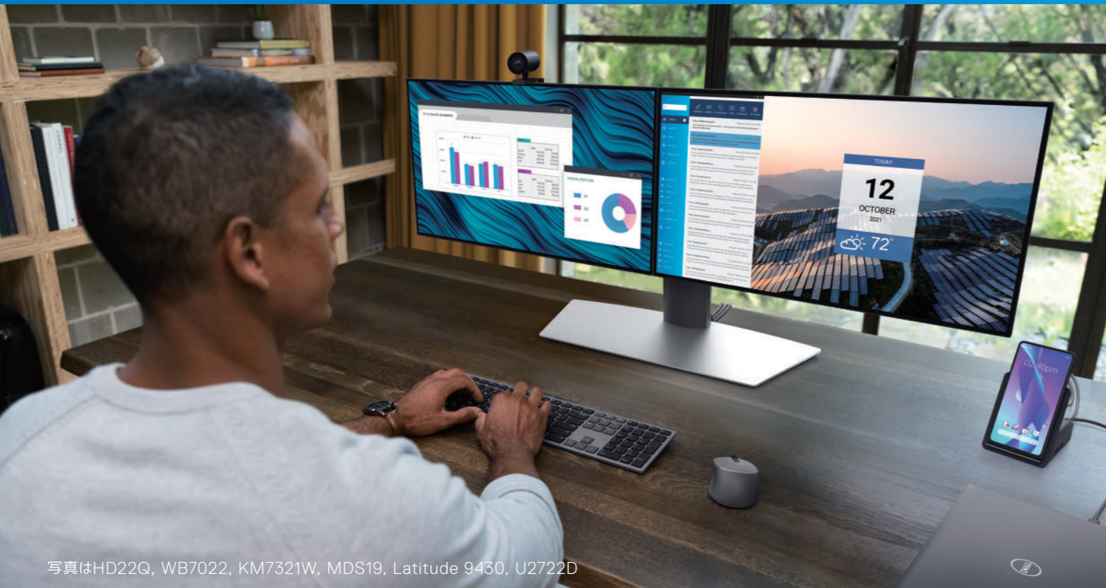
写真はHD22Q, WB7022, KM7321W, MDS19, Latitude 9430, U2722D