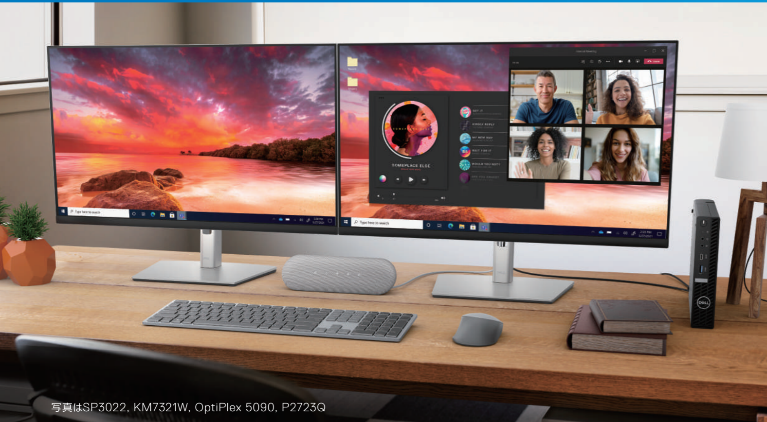
写真はSP3022, KM7321W, OptiPlex 5090, P2723Q