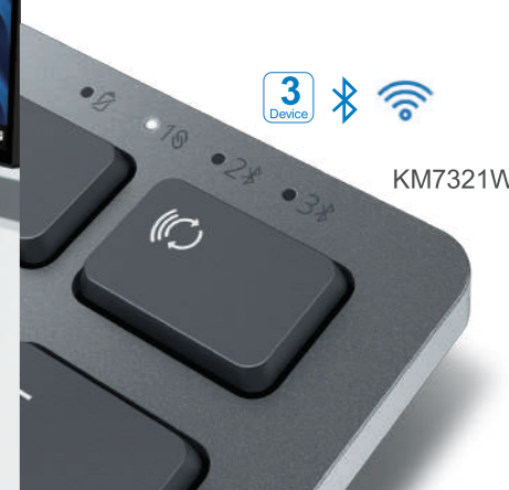
写真はKM7321W, WD22TB4 Dock, MD19S, WL5022, Latitude 7400, U2722D