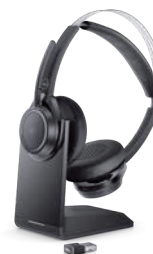
Premier ワイヤレス ANC ヘッドセット - WL7022

大型の 4K Sony STARVIS™ CMOS センサーと AI オートフレーミングで映像を最適化する。パワフルで インテリジェントな 4K Web カメラ 42 でビデオ会議環境を 向上させましょう。