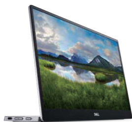
Dell コラボレーションシリーズ C1422H 14 インチ ポータブルモニター

この Teams 認定のワイヤレス ヘッドセットがあればどこでも簡単に コラボレーションでき、アクティブ ノイズ キャンセリング機能と スマート センサーにより、通話を自動的に ミュート / ミュート解除できます。