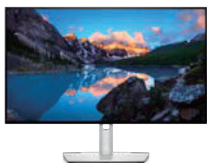
Dell デジタルハイエンドシリーズ U4021GW 40 インチワイド曲面 USB-C HUB モニター

ICES 2021 「イノベーションアワード」も受賞。 Thunderbolt 3 対応 5,120 x 2,160 高解像度 40 インチの 曲面大型モニターです。