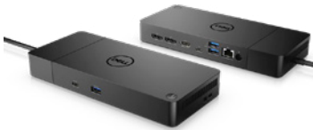
Dell Dock | WD19S

強力なUSB-CのDell Dockなら、フルスピードで作業できます。システムを迅速に充電できるほか、最大3台のディスプレイをサポートし、ケーブル1本で周辺機器に接続可能です。