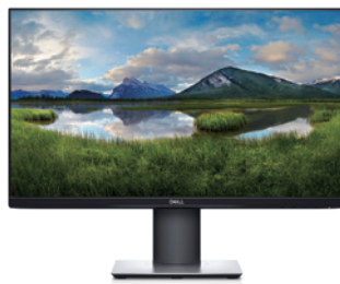
Dell 23.8インチワイド USB-C モニター | P2421DC

強力なUSB-CのDell Dockなら、フルスピードで作業できます。システムを迅速に充電できるほか、最大3台のディスプレイをサポートし、ケーブル1本で周辺機器に接続可能です。