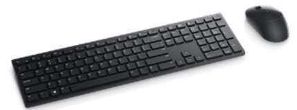
Dell Proワイヤレス キーボードおよびマウス | KM5221W

USB Type-Cに対応し、ケーブル1本で対応ノートPCに給電可能。視認性の高いIPSパネルに3辺極細ベゼルを採用したQHD解像度23.8インチモニターです。