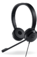
Dell Proステレオ ヘッドセット | UC150

ワイヤレス キーボードとマウスのセットを使用することで、1日中効率的に作業できます。デスクがすっきりと整理され、最大36か月のバッテリー持続時間とプログラム可能なショートカット ボタンにより、生産性を高く保てます。