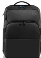
Dell Proスリム バックパック 15 | PO1520PS

幅広い種類のポートを搭載した、コンパクトな7-in-1 Dell USB-Cモバイル アダプターです。モニター、プロジェクター、ヘッドセット、キーボード、マウス、フラッシュドライブ、その他の周辺機器などの多様なデバイスとシームレスに接続できます。