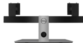
Dellデュアル モニター スタンド | MDS19

Dell Proステレオ ヘッドセットは1対1の通話品質向けに最適化されているので、一語一語がはっきり聞き取れます。