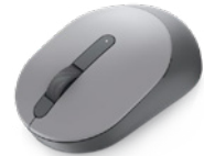
Dellモバイル ワイヤレス マウス | MS3320W

環境に配慮した素材と防水コーティングでお使いのデバイスをしっかり保護。毎日の持ち運びも安心です。