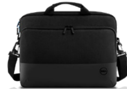
Dell Proスリム ブリーフケース15 | PO1520CS

最大65Whrの大容量の電力を迅速に供給できるモバイル バッテリーです。USB-C®に対応したノートPCやモバイル デバイスを充電できます。