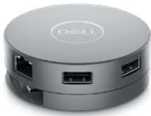
Dell USB-Cモバイル アダプター | DA310

幅広い種類のポートを搭載した、コンパクトな7-in-1 Dell USB-Cモバイル アダプターです。モニター、プロジェクター、ヘッドセット、キーボード、マウス、フラッシュドライブ、その他の周辺機器などの多様なデバイスとシームレスに接続できます。