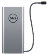
Dell USB-CノートPC用モバイル バッテリー 65W/65WHR | PW7018LC

デュアルモード接続(2.4GHzワイヤレスまたはBluetooth)と36か月のバッテリー持続時間により、シームレスに作業できます。