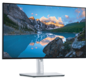
Dell デジタルハイエンドシリーズ U2422HE 23.8インチ USB-C HUB モニター

USB-Cケーブル1本で対応ノートPCにも給電しつつ、LAN端子を内蔵し安定したネットワーク環境が実現可能。高さ調整・回転機能付き23.8インチHUBモニターです。