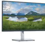
Dell プロフェッショナルシリーズ P2723D 27インチワイドモニター

USB-Cケーブル1本で対応ノートPCにも給電しつつ、LAN端子を内蔵し安定したネットワーク環境が実現可能。高さ調整・回転機能付き23.8インチHUBモニターです。