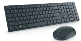
Dell Proワイヤレスキーボード およびマウス - KM5221W

3台のデバイスでシームレスにマルチタスクを実行でき、プログラム可能なショートカット機能と36か月のバッテリー寿命を搭載しています。*デルの分析 (2020年3月) に基づきます。