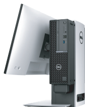
OptiPlex スモールフォームファクター All-in-Oneスタンド - OSS21

*デルの競合他社パーソナルビデオ会議スピーカーフォンとの比較分析 (2021年9月) に基づきます。