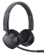
Dell Proワイヤレスヘッドセット - WL5022

このインテリジェントな2K QHD Webカメラで、業界をリードするビデオ品質と鮮明な画像をお楽しみください。