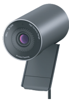
Dell Pro Webカメラ - WB5023

静音性に優れたフルサイズキーボードとマウスの組み合わせで、日々の生産性を向上させます。ショートカットはプログラム可能で、バッテリー寿命は最大36か月です。