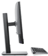
OptiPlex All-in-One 高さ調整可能スタンド

高さ、前後 / 左右の角度、縦横の回転で All-In-One を最も見やすい位置に調整できます。