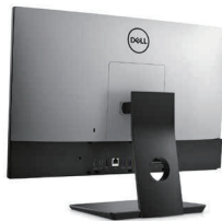
高さ調節可能スタンドに統合された OptiPlex All-in-One DVD+/-RW

高さ、前後 / 左右の角度、縦横の回転で All-In-One を最も見やすい位置に調整できます。