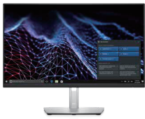
Dell プロフェッショナルシリーズ P2422H 23.8 インチ ワイドモニター

ComfortView Plus で常時眼に優しく、3 辺極細ベゼルを採用。あらゆる業種に最適な 23.8 インチ ビジネス用 スタンダードモニターです。