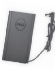
戴尔便携式电源伴侣 (18000 mAh) - PW7015L