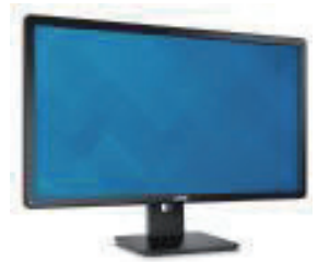
Dell 24 系列显示器 | E2417H