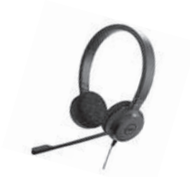
Dell Pro 立体声耳机 - UC350