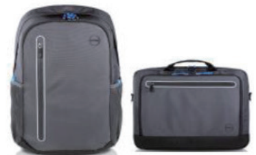
便于携带的 Dell Urban 双肩背包或公文包。