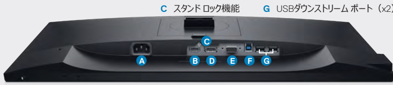
A 電源コネクタ B HDMIポート E VGAコネクタ C スタンドロック機能 G USBダウンストリームポート (x2) D DisplayPort F USBアップストリームポート