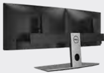
デル デュアル モニター スタンド | MDS 19

クイック リリース機能により工具なしにモニターを取り付けることができ、モニターごとに個別にピボット、傾き、回転、高さ調整を柔軟に行えます。小さい設置面積および整然としたケーブル管理機能を特徴としています。