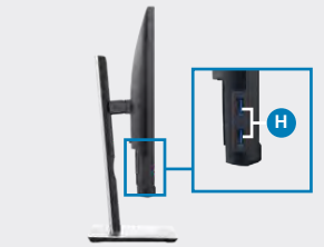
H USBダウンストリームポート (x2)