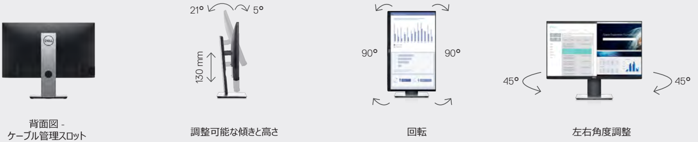
背面図 - ケーブル管理スロット